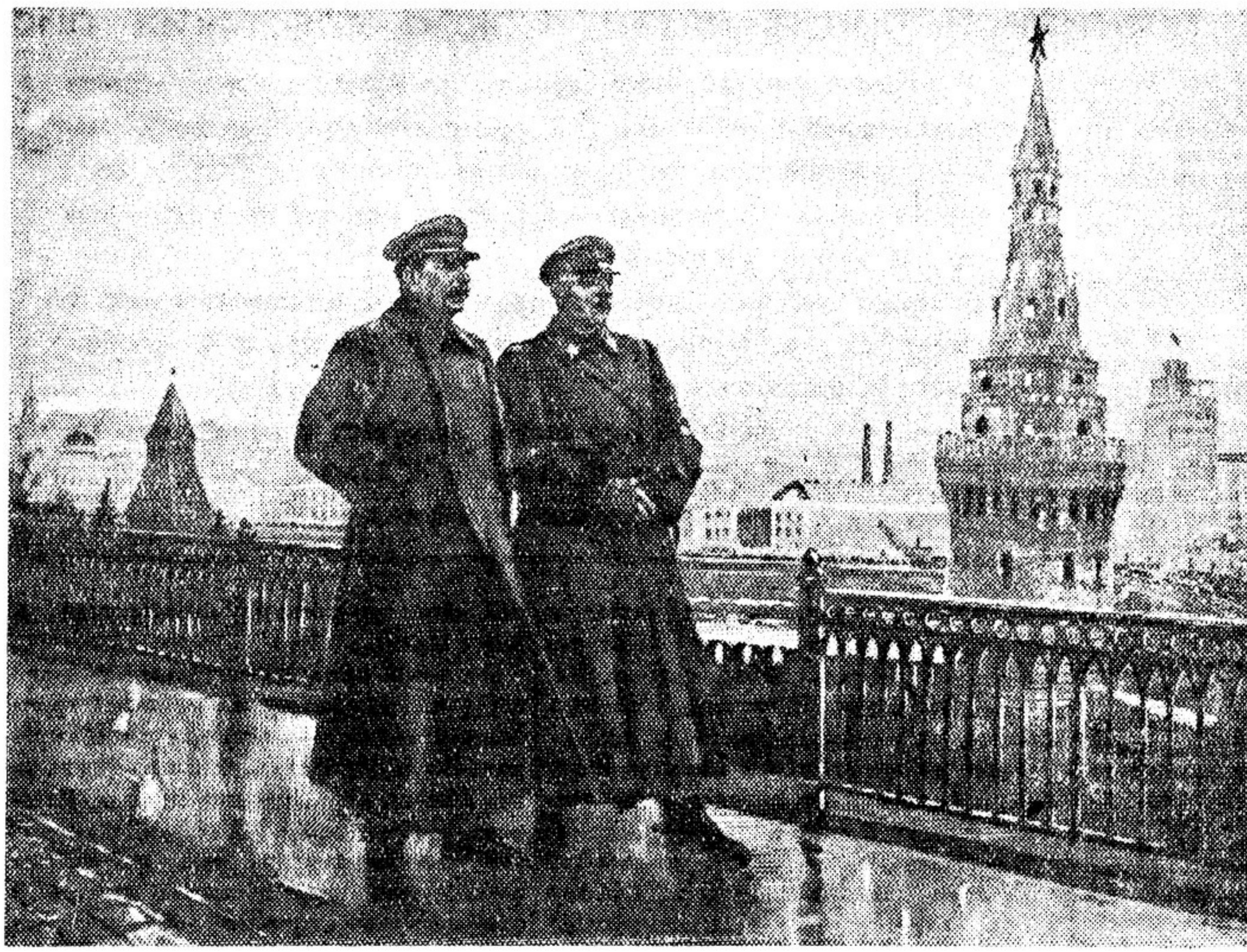
«И. В. Сталин и К. Е. Ворошилов в Кремле». Картина художника А. М. Герасимова на выставке лучших произведений советских художников.

Писать Клименту Ефремовичу Ворошилову мне приходилось не раз. Но если бы я знал о нем только то, что знает каждый гражданин нашей страны, мне, пожалуй, было бы очень трудно справиться со своей задачей живописца.